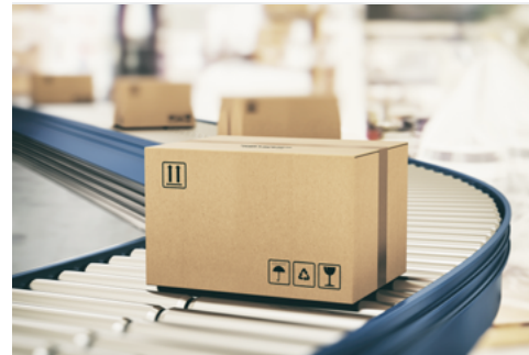
Stromversorgung von Anlagentechnik