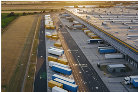
Stromversorgung für Logistikcenter