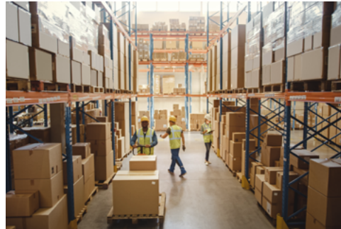
Gebäudeinfrastruktur und Auflieger