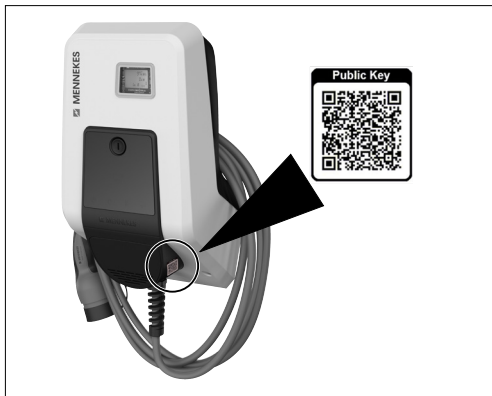
Abb. 4: Platzierung des Public Key

Der Public Key ist auf dem AMTRON® Professional angebracht.