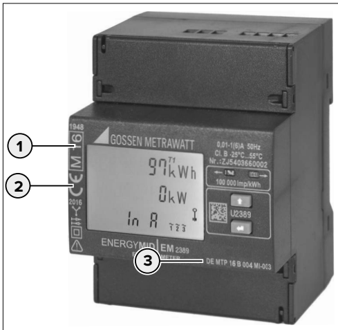
Abb. 2: Eichrechtkonformer Elektrizitätszähler

Ein eichrechtkonformer Elektrizitätszähler ist an den folgenden Symbolen erkennbar: