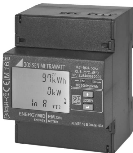
Abb. 1: Elektrizitätszähler (im AMTRON® Professional(+)* integriert)