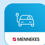
MENNEKES ativo 4Drivers App