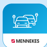
MENNEKES ativo 4Fleets App