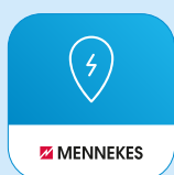
MENNEKES ativo 4Operators App