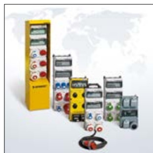
Steckdosen-Kombinationen für den weltweiten Einsatz