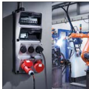
AMAXX® Steckdosen- Kombinationen nach DIN EN 61439