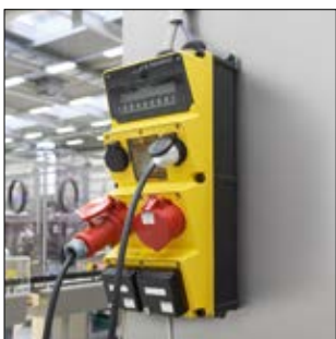
Lösungen für die Industrie 4.0