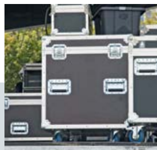
Events und Bühnenbau