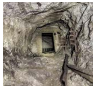
Stahl- und Bergbau