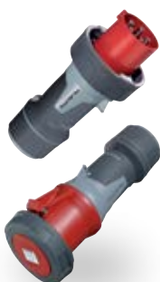
PowerTOP® Xtra Stecker/Kupplungen