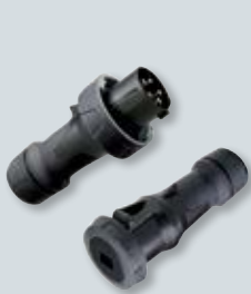
CEE-Stecker und -Kupplungen