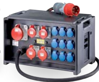
EverBOX – mobile Verteiler