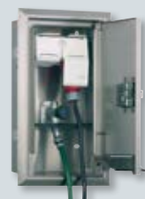
Unterputz-Kombinationen für Strom- und Wasseranschluss