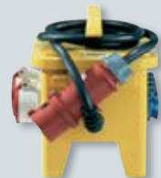
EverBOX GRIP – mobile Verteiler