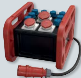
EverBOX GRIP – mobile Verteiler