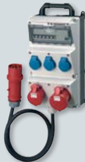
AMAXX® Messestand- kombination